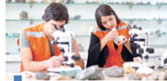
Ingeniería Civil en Minas