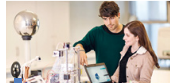
Ingeniería Civil Industrial